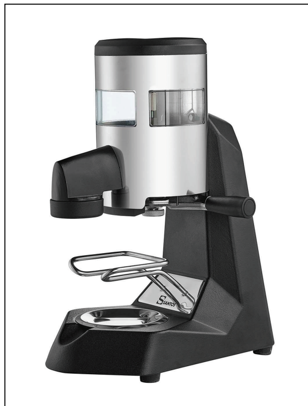
Model nr. 26

vertaling van de oorspronkelijke handleiding